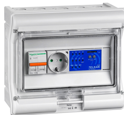
Ejemplo de Cuadro